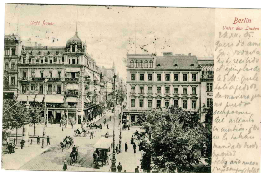
Figura 3 - Tarjeta postal enviada a Unamuno desde Berlín (CMU, 38/37, 13)

“Querido amigo: aunque sin papel sellado, voy á pedirle á V. oficialmente un servicio. Está llamando poderosamente la atención del mundo científico el descubrimiento que acaba de realizar Erlich: la curación de la sífilis eficaz y rapidísima. Las estadísticas en Rusia, en Alemania ya demuestran que la cosa es seria y asombrosa. / [v.] Yo quiero ir con mi hijo Tomás á Francfort-sur-Maine, al Laboratorio Erlich” 29